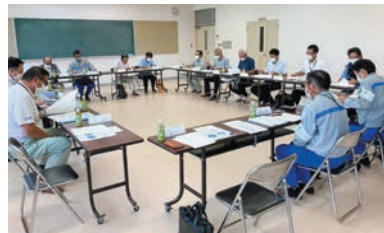
安全防犯協議会開催風景

併せて、協議会で確認されました島内主要箇所への防犯カメラの設置状況について報告さ