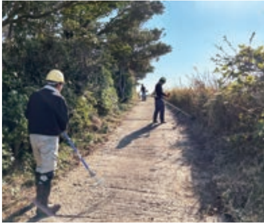
事業地周辺道路の草刈りの様子

9月より島内全域に渡り、耕作地への通行を確保するため、草刈り・枝切りを実施しています。島内の東側は年内の完了を見込んでおり、西側については来年も引き続き、対応して参ります。作業期間中は車の往来等に注意しながら作業を進めて参りますので、ご協力を賜りますようお願い致します。