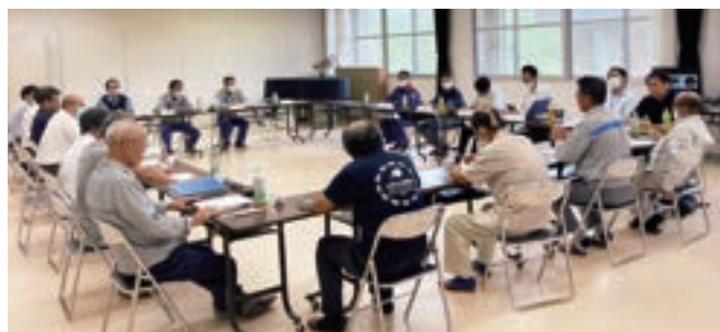
第9回安全防犯協議会の様子

9月26日、宇久地区コミュニティセンターにて、第9回安全防犯協議会を開催しました。事業者より、交直変換所建設工事を始めとする現在の進捗状況および今後の工事予定について説明し、安全防犯に関する取り組みについて協議を行いました。なお、協議の詳細は議事録として記録しており、九電工務所にて閲覧頂くことが可能です。議事録の閲覧を希望される方は、裏面に記載の連絡・相談窓口までお問合せ頂く、もしくは九電工務所までお越し下さいますようお願い致します。