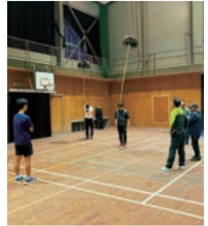
旧神浦小学校の体育館での練習風景