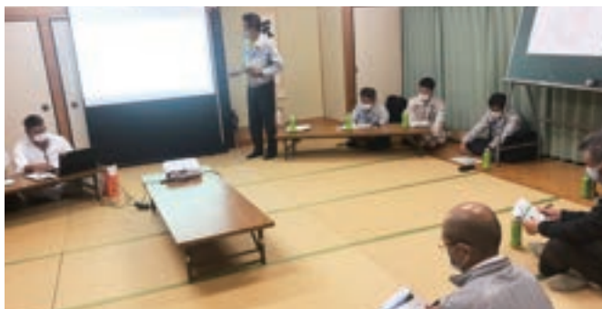
飯良地区にて開催した説明会の様子

11月7日に飯良地区の皆様にお集まり頂き、事業に関する説明会を実施致しました。今後、飯良地区から工事を進めていくこととなりますが、事故のないよう安全第一で取り組んで参ります。また、11月27日、30日に平7地区でも説明会を実施致しました。ご参加下さいました飯良地区及び平7地区の皆様、誠にありがとうございました。工事にあたりまして、ご迷惑をお掛け致しますが、ご理解ご協力のほどよろしくお願いいたします。